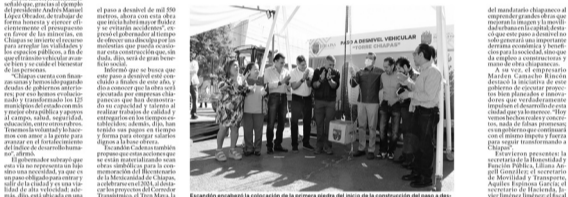
Escandón encabezó la colocación de la primera piedra del inicio de la construcción del paso a desnivel de la Torre Chiapas. CP

El gobernador subrayó que esta obra no es un lujo, sino una necesidad para desahogar el tránsito vehicular y evitar accidentes que pongan en peligro la vida de las personas