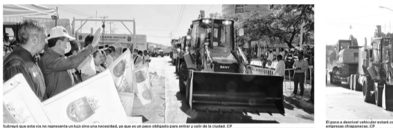
El paso a desnivel vehicular está en obras en Chiapas. CP

Los proyectos fueron fuertemente criticados por activistas ante el impacto ambiental. Promueven 30 amparos