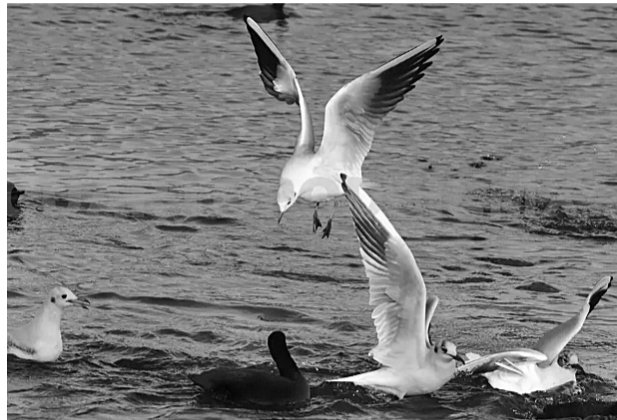
Las aves amanecieron muertas en toda la costa.