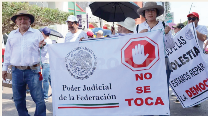
Las marchas y plantones por parte de los trabajadores comenzarían a ser cotidianos. Archivo CP

AMLO anuncia intención de enviar una iniciativa de reforma constitucional para que jueces, magistrados y ministros fueran electos por voto popular