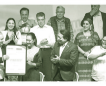
Sheinbaum aseguró que el partido está listo para enfrentar el desafío de 2024 en el marco del Premio Ampleo por México

La doctora Sheinbaum se convirtió en la candidata de Morena después de una encuesta dentro del partido.