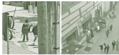
Los captores pedían las “cabezas” de tres mandos de la Secretaría de Seguridad de Chiapas.