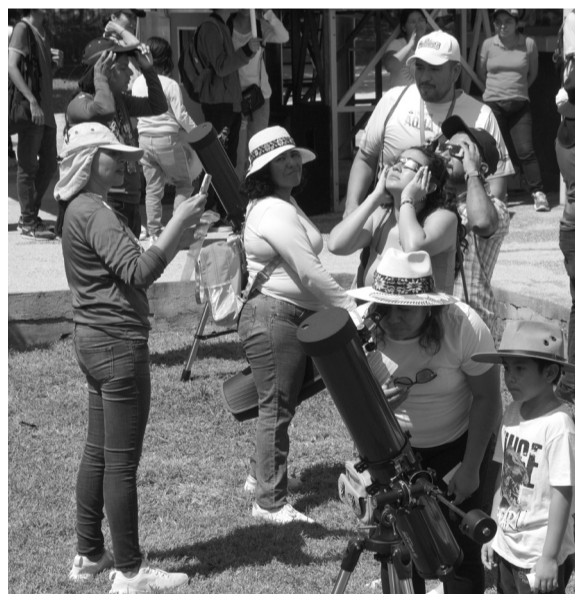
Las observaciones se hacían con estrictas medidas de seguridad.

El próximo eclipse de esta magnitud será visible en la región hasta dentro de 33 años. ◀