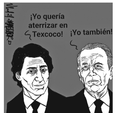
Empresarios preocupados por qué se frenó el aeropuerto de Texcoco.