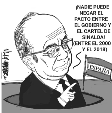
Los constantes y cuestionados pactos del narcotráfico con el gobierno.