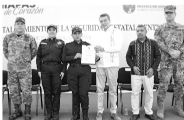
Acciones de seguridad del exgobernador REC.