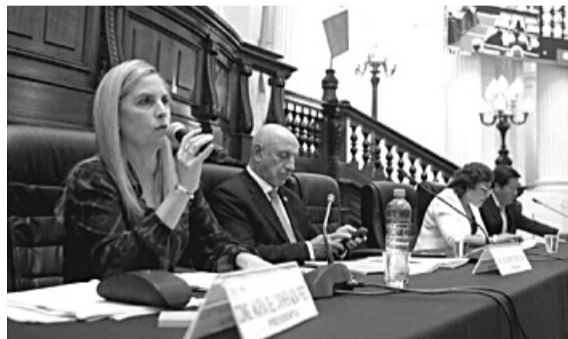
El Congreso de la República del Perú lo declaró non grata por sus comentarios que fueron vistos como injerencia política.