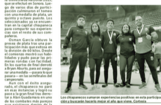
Los chiapanecos sumaron experiencias positivas en esta participación tras haberse clasificado al año anterior. Cortina

Los estudiantes de la escuela artemarcialista brillaron en su primera participación en la Universiada Nacional 2023