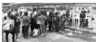
Alimentos, medicamentos, consultas médicas y limpieza en general se brindaron en las instalaciones de Plaza Las Américas. CP

El grupo de migrantes que se encuentra en las afueras de Plaza Las Américas, en el norte-occidente de Tuxtla Gutiérrez, busca apoyo para continuar su camino hacia los Estados Unidos de Norteamérica. Aquí los grupos de ayuda humanitaria entregan alimentos, algunos insumos como toallas, jabones, paños, toallas sanitarias y algunas veces ropa, por lo que este día no fue la excepción.