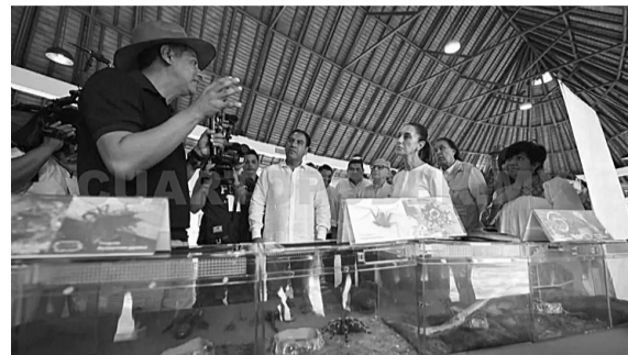
Los Centros de Atención a Visitantes y el Hotel SEDENA fueron pensados para mejorar la experiencia de los turistas en la zona arqueológica.

proyectos fueron la opacidad en los manifiestos de impacto ambiental y en transparencia de recursos, y una apertura que tuvo el 50 % de ocupación en hoteles de la zona maya.