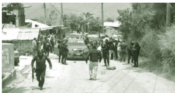
El grupo delictivo es señalado de cobrar ‘derecho piso’, asaltos, vandalismo y hasta de fungir como sicarios.

Los grupos criminales buscaban controlar la ruta de tráfico entre Chiapas y Guatemala.