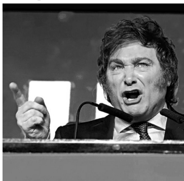
Javier Milei prometía acabar con la crisis económica y cambiar el rumbo de la política argentina.

Otras propuestas extremas son la prohibición del aborto, modificar las leyes de portación de armas y aliarse a países que estén en contra del socialismo. ◀