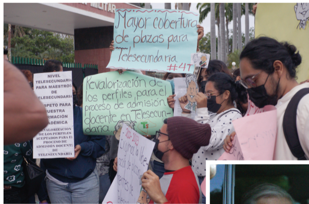
El presidente no sostuvo una reunión formal con los manifestantes, solo algunos entregaron peticiones.