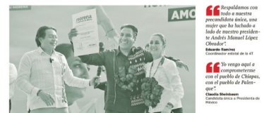
En esta visita exteriorizó su compromiso con el pueblo de Chiapas, con el pueblo de Palenque.

En su visita al pueblo mágico de Palenque, el ex jefe de Gobierno de la Ciudad de México ratificó al "Jaguar negro" como el defensor de la transformación en Chiapas