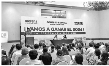
Reunión del Consejo Estatal de Morena.