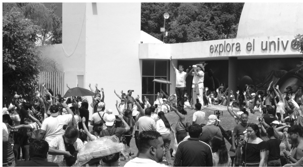
Cientos de personas vivieron con emoción el eclipse.