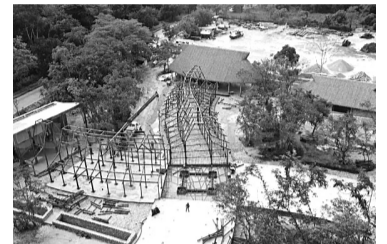
Palenque fue declarada Santuario de la Paz por la Alianza Internacional por los Derechos de la Madre Tierra.