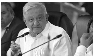
Retrato de AMLO el mejor líder de Morena.