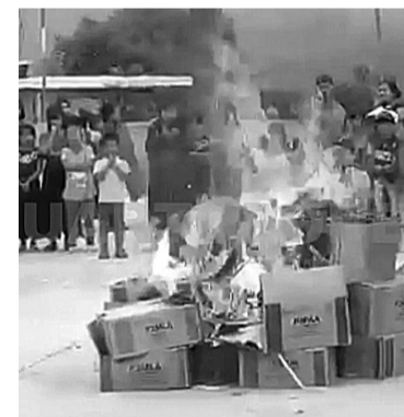
Las quemaduras de los libros fueron una constante en el país.