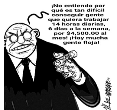
Los empresarios no saben ¿quién podría desaprovechar la oferta?.