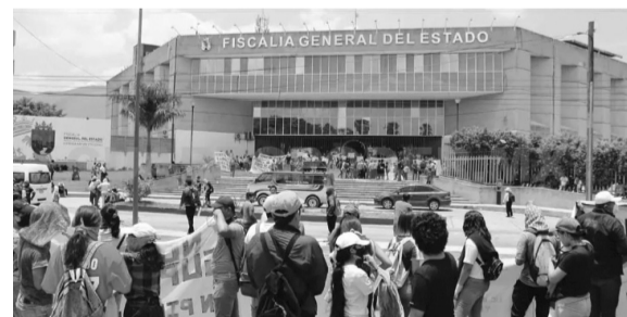
Los padres de familia pidieron investigaciones y condenaron la detención con violencia de sus hijos.

brecha digital en la que vivían la mayoría de los aspirantes a la escuela, muchos originarios de zonas campesinas e indígenas, donde el internet es un lujo al cual no tenían acceso. En 2020, sólo el 20 % de los aspirantes pudo realizar trámites en línea.