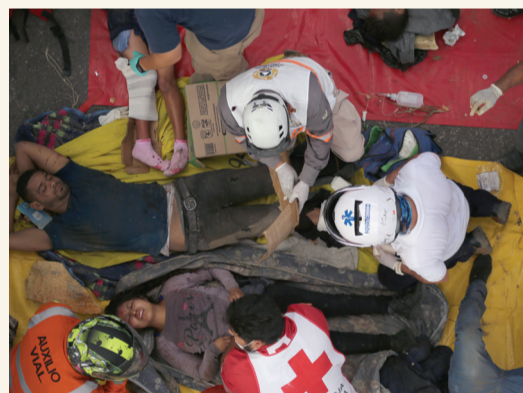
El fotoperiodista retrató con estética la tragedia.

El fotoperiodista Jacob García recogió a Carlos en una moto que a toda marcha esquivó el tráfico que ya colapsaba la salida a Chiapa de Corzo.