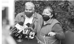
En conferencia de prensa, nueve de las víctimas detallaron que no han recibido ayuda.

El funcionario explicó las líneas de acción que el gobierno de la Ciudad ha emprendido desde el día de la tragedia, y comentó que al núcleo de las 26 familias de las personas fallecidas, se les hizo entrega