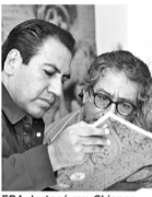
ERA destacó que Chiapas es pionero de la democracia participativa. CP

Como parte de los festejos por los 200 años se publicó el libro "Los Bicentenarios de Chiapas. De la Independencia a la Federación". Archivo CP