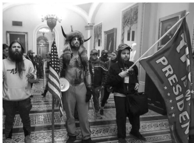
Miles de seguidores de Donald Trump asaltaron el capitolio de forma violenta.