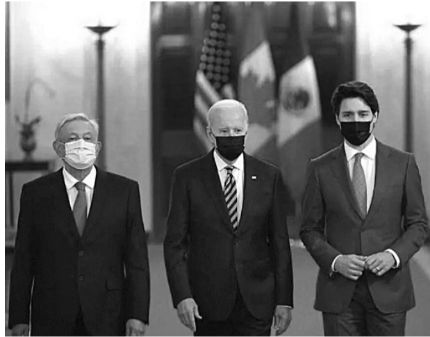
Foto histórica en la que se ve a los tres mandatarios en la casa blanca.