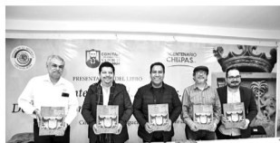
Presentación del libro "Los Bicentenarios de Chiapas. De la Independencia a la Federación". CP

Chiapas es un estado libre y soberano que decide fede-