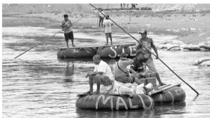
En el entorno de la migración hay barreras al servicio de salubridad y malas condiciones de vida, lo que puede representar riesgos para la salud.

Consolidadas como santuarios del hacinamiento, desprovistas de normas sostenidas de higiene y relegadas a los últimos lugares de atención sanitaria, las cárceles de América Latina y el Caribe podrían convertirse en uno de los focos de mayor impacto por la pandemia del Covid-19 para una población penitenciaria regional de casi un millón 600 mil reclusos.