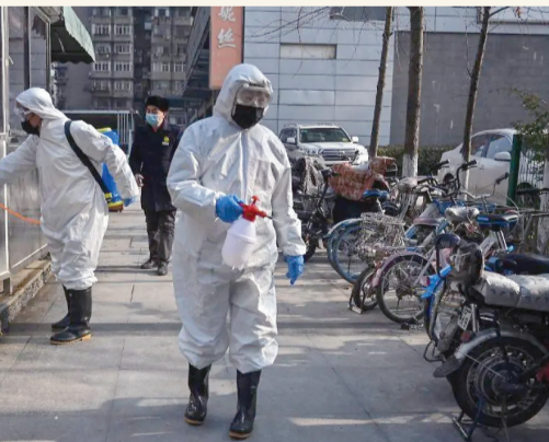
Estrictos protocolos se activaron en todo el mundo.