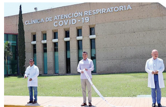
Corte de listón de la clínica para atención del virus chino.