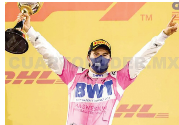
Nota sobre el gane del tapatío.

Sergio "Checo" Pérez logró su primera victoria en la Fórmula 1 tras una increíble y cerrada remontada. Se convirtió en el segundo mexicano en ganar una carrera en la máxima categoría del automovilismo en 50 años. Checo estaba en la incertidumbre por que no tenía asegurado un asiento para la temporada 2021, y con el gane logró que Red Bull lo fichara para el 2021. ◀