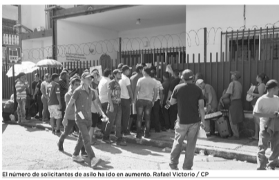
El número de solicitantes de asilo ha ido en aumento. Rafael Victoria / CP

El reporte anual del organismo señala que Chiapas es el estado en donde más se recibieron peticiones con 45 mil