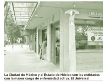
La Ciudad de México y el Estado de México con las entidades con la mayor carga de enfermedad activa.

Quedó en duda una buena noticia, en la tarde que habló con el presidente de la República, se autorizó que a conocer que para detener el turismo interno.