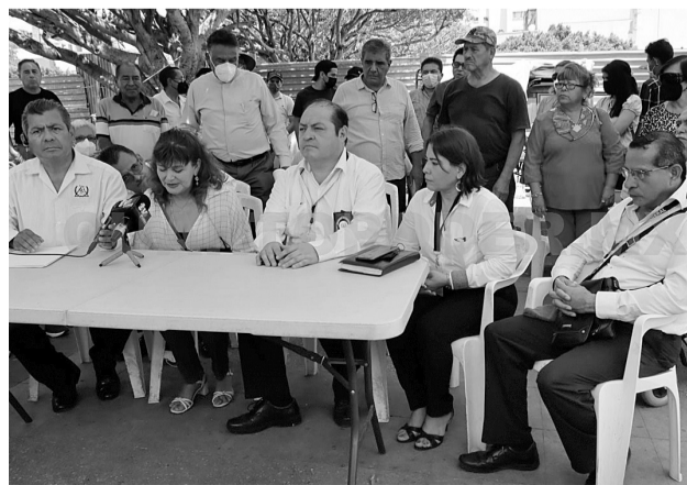
La deuda a las y los socios accionistas sería pagada hasta febrero de 2025, en la administración de Eduardo Ramírez.