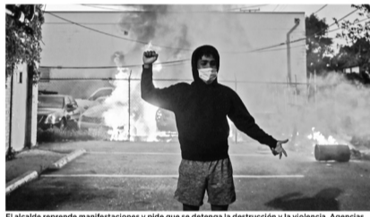
El alcalde reprime manifestaciones y pide que se detenga la destrucción y la violencia.

Medios locales, como ABC, reportaron que Walz señaló que los agentes del orden se enfrentaron a artefactos explosivos improvisados