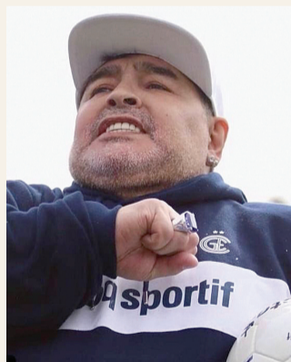
Maradona falleció el 25 de noviembre de 2020.

Un paro respiratorio dio fin a la vida pero no a la leyenda del ídolo argentino