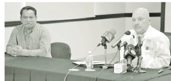
El funcionario reiteró el llamado a quedarse en casa y seguir las recomendaciones sanitarias.