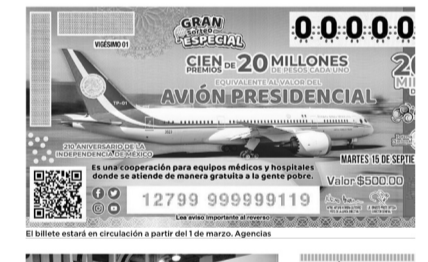
El boleto estará en circulación a partir del 1 de marzo.

El Ejecutivo Federal dijo que el sorteo se realizará el 15 de septiembre y se venderán seis millones de cachitos a un costo de 500 pesos