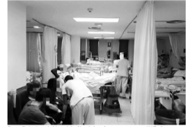
Beneficiarios del Insabi sólo deberán presentar su INE, CURP o acta de nacimiento para recibir los servicios de salud. Twitter

Con la entrada del Instituto, las personas sin seguridad social recibirán atención médica y medicamentos gratuitos sin restricciones