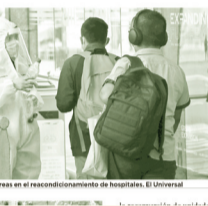
Fuerzas Armadas desarrollan tareas en el recondicionamiento de hospitales.

Cuatro de cada diez muertes en México por covid, se debieron a la pésima gestión gubernamental.