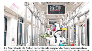
La Secretaría de Salud recomienda suspender temporalmente a partir de mañana todas las actividades no esenciales. El Universal

¿Qué significa cuarentena? De acuerdo a la Ley General de Salud, se entiende por cuarentena "la limitación a la