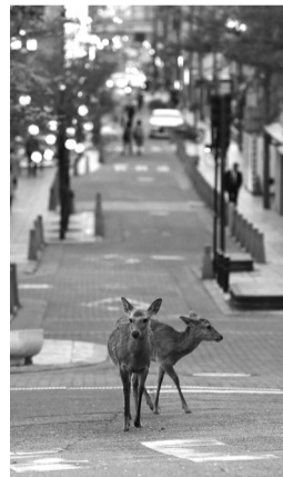
Las emisiones de CO2 cayeron un 17 % durante la pandemia.

Cuando los humanos se guardaron en su hogares y los autos dejaron de circular, la naturaleza retomó las ciudades. Ciervos paseando en Japón, pumas en las calles de Chile, familias de jabalíes por las avenidas de España, peces y cisnes en los canales de Venecia. La “antropopausa” permitió que las especies recorrieran distancias 73 % más largas y se acercaban 36 % más a las carreteras.