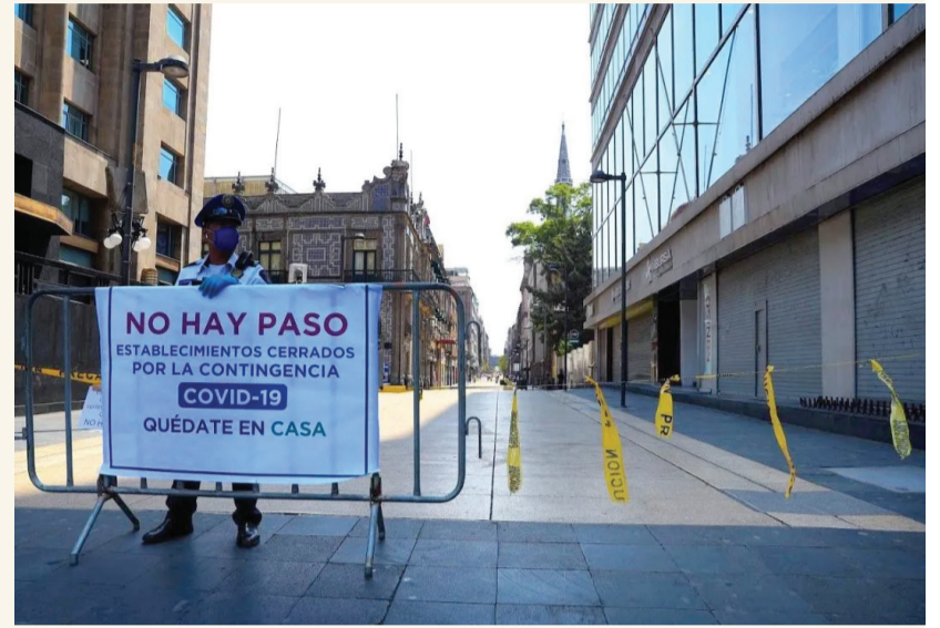
El programa de contingencia "Quédate en casa" vació las calles del país.

En México los fallecimientos a causa de este virus cobraron la vida de más de medio millón de personas entre 2020 y 2023