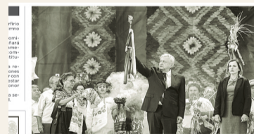
El presidente Andrés Manuel López Obrador recibió de representantes de los pueblos indígenas y afrodescendientes del país el Bastón de Mando.

se le entregó la banda presidencial. En un discurso de 50 minutos, AMLO anunció el inicio de la Cuarta Transformación, con miras a lograr 25 proyectos prioritarios, 12 prioridades legislativas y 50 puntos de austeridad. "Me canso ganso", dijo en San Lázaro al sostener que el funcionamiento del AIFA estaría en menos de tres años y que se sometería a la revocación de mandato. Subrayó que "la política neoliberal ha sido un desastre, una calamidad", dando camino al primer gobierno de izquierda del México moderno.