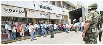
Con la expectativa que el 8 de julio se de a conocer el computo de la elección a Gobernador y la declaratoria de validez de esa elección. CP

Explicó que el proceso electoral no ha concluido y llamó a quienes tengan informaciones a presentar sus denuncias ante las instancias pertinentes, evitando confrontaciones y violencia entre chiapanecos.