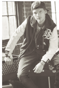
Avicii catapultó el EDM a nivel internacional.

La familia declaró que el autor de Wake Me Up, "no podía continuar" y que "quería encontrar la paz". Y en su honor creó la Fundación Tim Bergling, dedicada a la prevención del suicidio y la desestigmatización de los problemas de salud mental.