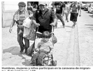
Hombres, mujeres y niños participan en la caravana de migrantes.

Resguardados por personal del Grupo de Protección a Migrantes "Beta Sur", elementos de corporaciones policíacas estatales y federales, recorren tramos caminando y otros en vehículos.