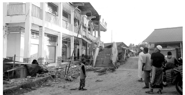
Cientos de estructuras se derrumbaron, dejando a personas enterradas.

“México, Estados Unidos y Canadá están listos para iniciar una nueva etapa juntos”, afirmó el presidente saliente de México, Enrique Peña Nieto, al firmar el Tratado de Libre Comercio con sus homólogos Donald Trump, de USA, y Justin Trudeau, de Canadá, durante la Cumbre de Líderes del G20 en Argentina. El acuerdo comercial entre las tres naciones de América del Norte trajo distintos beneficios, sin embargo, ha vuelto dependiente a la economía mexicana del mercado estadounidense con el 83 % de las exportaciones hacia Estados Unidos. Después de tres meses de negociaciones, el antiguo Tratado de Libre Comercio de América del Norte (TLCAN) se transformó en el Tratado entre México, Estados Unidos y Canadá (TMEC).