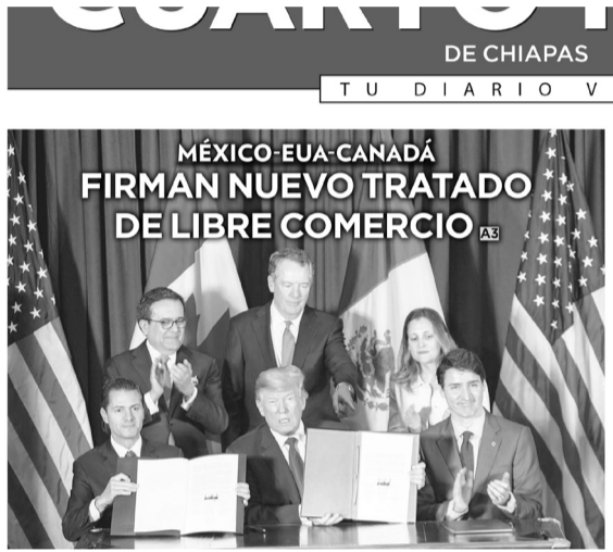
MÉXICO-EUA-CANADÁ FIRMAN NUEVO TRATADO DE LIBRE COMERCIO

El tratado fue firmado en la cumbre del G20, en Argentina, y contemplaba cambios y una nueva fecha de caducidad