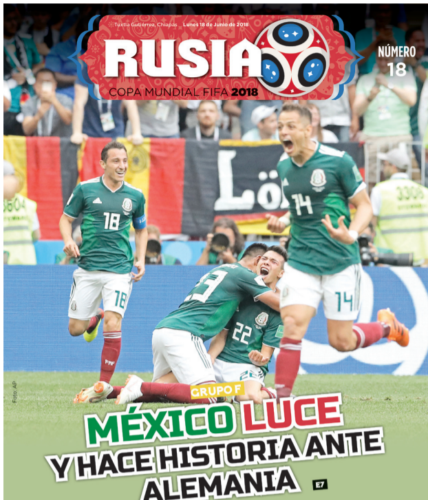
Uno de los momentos recordados de este Mundial es el gol del "Chuky" Lozano.