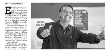
Bolsonaro deberá ahora enfrentarse a Haddad.

Con más de 49 millones de votos, el candidato esperaba evitar la segunda vuelta, pero tendrá otros 20 días de campaña contra Haddad