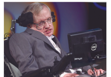
En 2014 se produjo una película sobre su vida llamada "La teoría del todo".

La vida del científico británico Stephen Hawking, fallecido este miércoles, fue llevada a la gran pantalla en 2014 en la cinta 'La teoría del todo' (The Theory of Everything), filme biográfico dirigido por James Marsh y producido por Anthony McCarten. La película está basada en