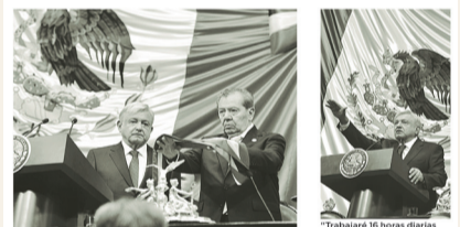
El mandatario está consciente de la expectativa que tienen los mexicanos sobre el nuevo gobierno.

Izquierda. Aspectos de la toma de protesta de AMLO en San Lázaro.