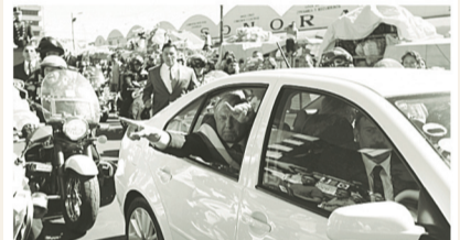
AMLO dijo que un joven en bicicleta se le acercó "y me dijo: no tienes derecho a fallarnos, y ese es el compromiso que tengo con el pueblo de México".