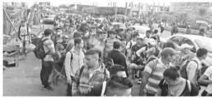
La caravana de migrantes 2018 partió de la frontera sur hacia Sonora y Baja California.

Miles de migrantes optaron por organizarse y viajar juntos para tener mayor seguridad y apoyo.