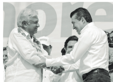
Rutilio Escandón pasó a la historia como el primer gobernador del Partido Morena.

Rutilio se volvió el heredero de Manuel Velasco después de colaborar juntos desde el Poder Judicial del Estado en el sexenio verde, y bajo la declaración de tener una gestión "para pasar a la historia con un gobierno austero, pero eficaz", el primer mandato moreno llegó a Chiapas.