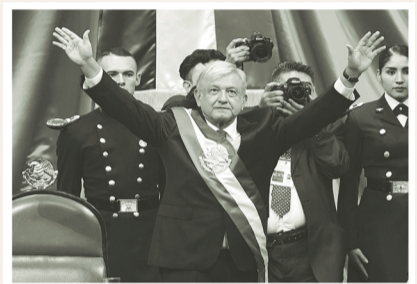
Expresó que el día de hoy comienza el cambio de régimen político, se llevará a cabo una transformación pacífica y ordenada.

En su primer mensaje como presidente de la República, Andrés Manuel López Obrador aseguró que se someterá a la revocación de mandato A3-A7, B15