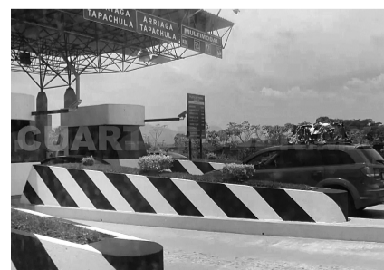
La iniciativa privada se quedó con las joyas de la corona carreteras.

dores sin empleo y 100 más afectados de forma indirecta, y los sindicalizados fueron removidos a otras partes del país. ◀