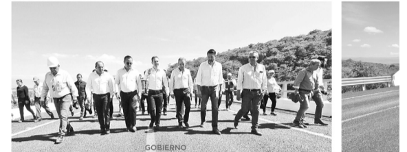
GOBIERNO INAUGURA VELASCO NUEVO LIBRAMIENTO SUR EN TUXTLA

La vía conectará los municipios de la zona centro y frailesca, además se impulsarán las diferentes actividades económicas que se realizan en toda la región