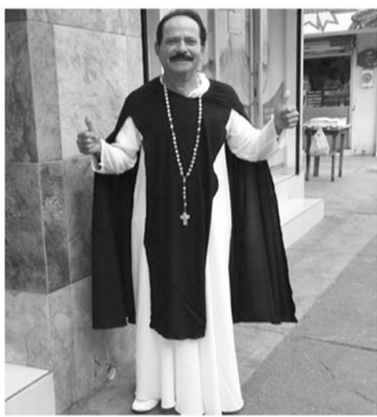
“El Chelén” apareció vestido con una indumentaria de San Martín de Porres. El Universal

del PRI; tres años después repitió la hazaña impulsado por la coalición PAN-PRD-PT. En su desempeño en el cargo ha escenificado veladas boxísticas, la más reciente a fines del año pasado ante „El