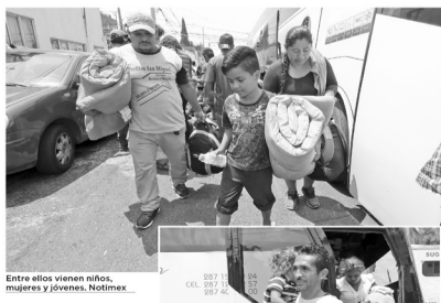
Entre ellos vienen niños, mujeres y jóvenes.

Las represiones de Ortega dejaron un saldo de 351 muertos.