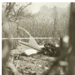
Restos del helicóptero donde viajaban los funcionarios, el hecho conmocionó a todas las cúpulas políticas.

El 24 de diciembre, a tan sólo 10 días de haber asumido la gubernatura de Puebla en un cuestionado y reñido proceso electoral, Martha Erika Alonso Hidalgo falleció junto a su esposo, el senador y exgobernador Rafael Moreno Valle. El helicóptero en el que viajaban se desplomó por fallas mecánicas, de acuerdo con peritos internacionales. Los poblanos, volvieron a salir a las urnas en 2019 para poner fin al morenovallismo, un pilar fundamental del PAN. Puebla se encarriló a la amalgama de Morena con Miguel Barbosa como gobernador electo, político que falleció a mitad de su gobierno. ◀