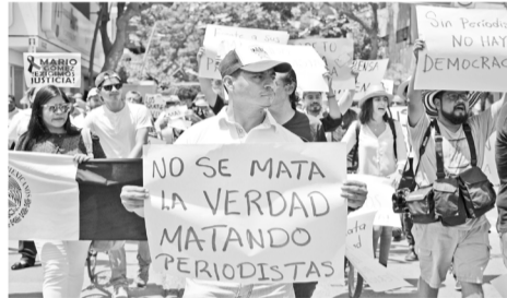
Marchan periodistas en Chiapas para exigir respeto al trabajo que se realiza.

"No más asesinatos de periodistas en Chiapas", "exigimos justicia", "alto a la muerte de periodistas", "prensa viva y libre" y "estamos vivos", "no más sangre", son algunos