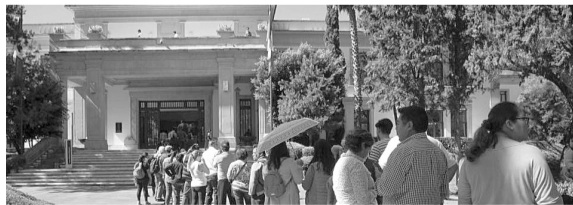
Los Pinos fue la casa de 14 presidentes del país; el 1 de diciembre se apertura al público.

fueron recibidos 30 mil visitantes el primero de diciembre de 2018 en la inauguración del Complejo Cultural Los Pinos a cargo de la Secretaría de Cultura.