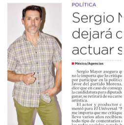
POLÍTICA Sergio Mayer dejará actuar

Mayer destacó por su incompetencia dentro de la Comisión de Cultura de la que declaró no requería ser Sócrates para hacerse cargo; con escándalos como compartir links de descarga de libros que no contaban con los permisos legales o decir que el sueldo de diputado no era suficiente para su estilo de vida. También afirmó que "Sólo para mujeres" impulsó los derechos de las mujeres. En 2019, la legisladora Inés Parra acusó a Mayer de cobrar un moche del 30 % en proyectos integrados en el presupuesto. ◀