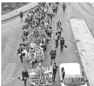
Unos mil 500 centroamericanos emprendieron la caminata hacia el norte del país.

lén hacia parque central de Tapachula de donde salieron caminando haciendo su pri-