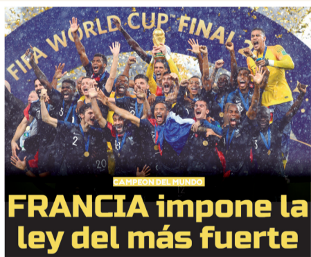
El coliseo del Luzhnikoi fue el magno escenario de un cambio de orden, quizá de estilo tras el buen gusto del juego combinativo de España en 2010 y de Alemania en Brasil 2014

Es de destacar que ésta sería la última participación de Rusia en un Mundial de la FIFA, ya que fue vetada por comenzar una guerra con Ucrania en febrero de 2022.