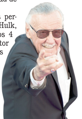
La leyenda falleció por complicaciones a su salud.

Stanley Martin Lieber, conocido artísticamente como Stan Lee, el legendario escritor, editor y productor estadounidense que catapultó el universo de Marvel Comics, falleció a los 95 años el 12 de noviembre, en la ciudad de Los Ángeles, California. Fue creador de los míticos personajes de Spider-Man, Hulk, Iron Man, Thor, X-Men, Los 4 Fantásticos, Daredevil, Doctor Strange, Pantera Negra y Los Vengadores, entre otros. El neoyorkino lideró la Edad de Plata de los cómics en los años 60 y humanizó a los superhéroes dotándolos de defectos y problemas reales.