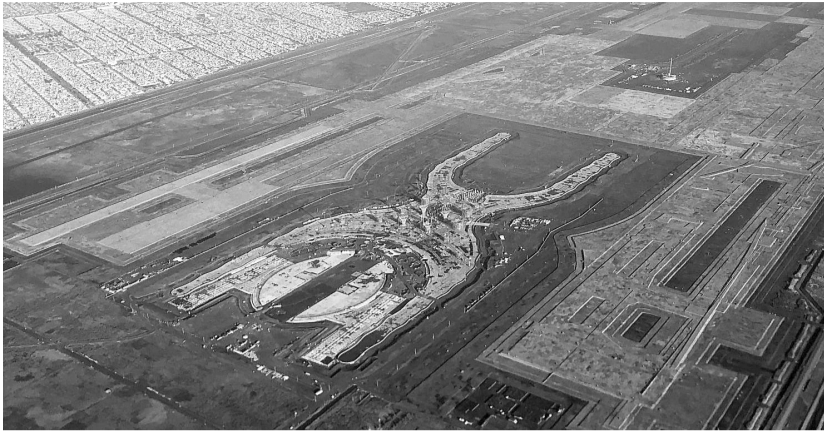
Después de una consulta nacional realizado por AMLO, se canceló el NAIM.