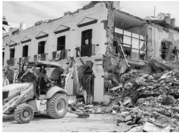
Juchitán, Oaxaca, fue una de las ciudades más afectadas.