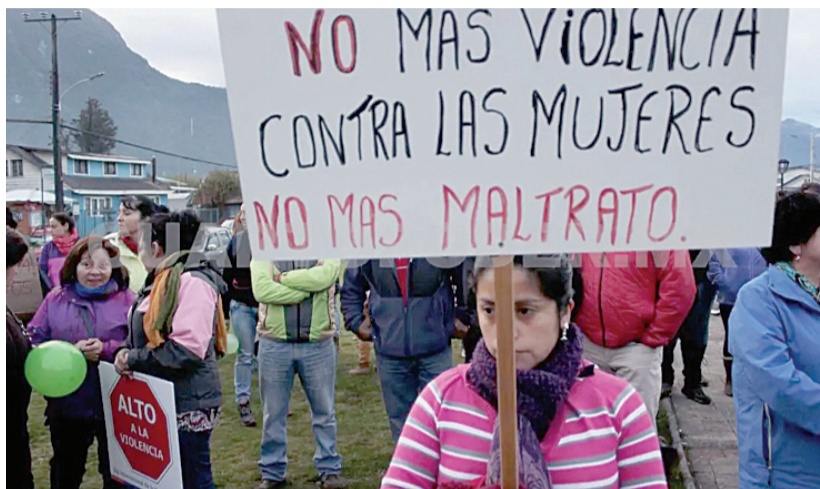
La Alerta de Género se activó para siete municipios.

violencia y feminicidios. Sin embargo, la alerta solo se emitió para 7 de los 122 municipios y se proclamaron acciones en la región de Los Altos, con alta población indígena. Contrario al discurso que proclamaba proteger a las mujeres, en Los Altos aún se con-