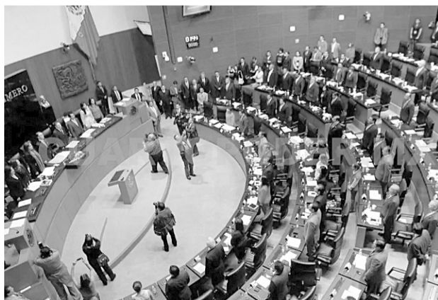
La Cámara de Senadores solicitó a la PGR investigar los casos de espionaje.

Las investigaciones periodísticas y de transparencia revelaron que el software Pegasus era capaz de infiltrarse en los dispositivos de las personas en tiempo real. Puede grabar las pulsaciones en el teclado, utilizar aplicaciones cifradas, usar la cámara y el micrófono, logrando extraer la información, incluso cuando el dispositivo parece estar apagado. Si bien, el programa era usado para investigar al crimen organizado, también se utilizó para investigar a periodistas, activistas y defensores de derechos humanos. Una investigación del The New York Times reveló que la Se-