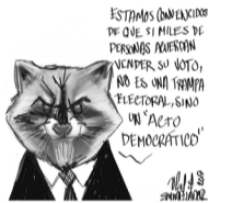
Democracia cuestionada por un lindo y trajeado mapache.