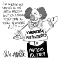
Caricatura ante el auge de las candidaturas independientes.