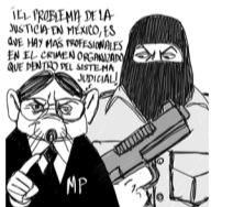
El crimen organizado tenía personal más "profesional".