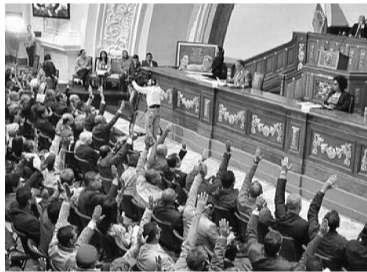
La Ley contra el Odio, por la Convivencia Pacífica y la Tolerancia, propuesta por el presidente Nicolás Maduro, castigaba con penas de hasta 20 años de cárcel por "incitación al odio". La CIDH instó al gobierno a reconsiderar esta medida.