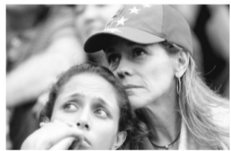
Condena la SIP "amenazas"

Los arrestos de Leopoldo López y de Antonio Ledezma son para atemorizar a la oposición, denunció el primer vicepresidente del Congreso, Freddy Guevara