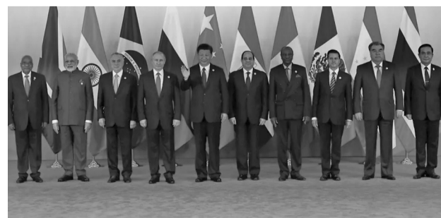
Peña Nieto, con los presidentes de BRICS.

exportación, de acuerdo con la Secretaría de Relaciones Exteriores. La invitación fue sólo un coqueteo con los ahora grandes monstruos económicos. Al final, México renegoció el T-MEC, su principal pilar económico al representar el 80 % de las exportaciones con destino a Estados Unidos. ◀