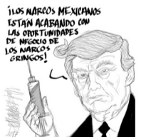
Los intereses del Tío Sam se vieron afectados por el narco mexicano.