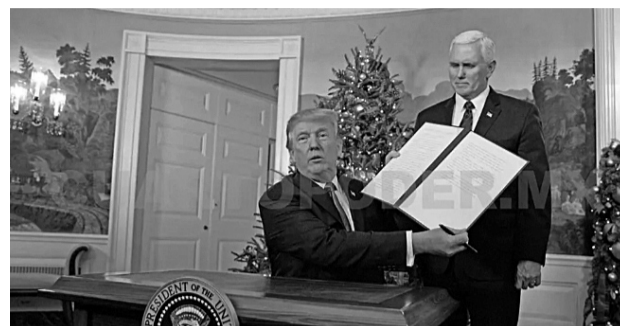
Esta declaración fue aplazada desde la gestión de Bill Clinton.