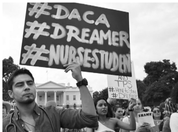
Donald Trump canceló el Programa de Acción Diferida para los Llegados en la Infancia (DACA), 787 mil 580 beneficiarios, llamados dreamers fueron afectados. "Amo a los dreamers, pero no tuve opción", dijo Trump.