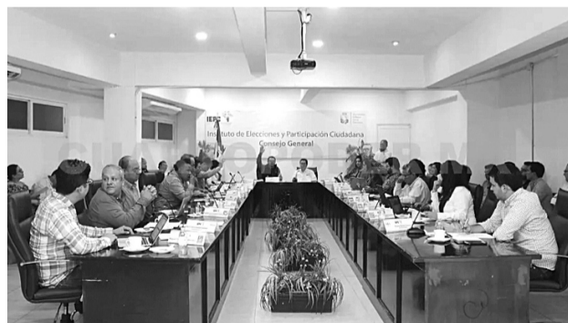
Noticia en donde se dio a conocer la aprobación de la Ley de Reelección.