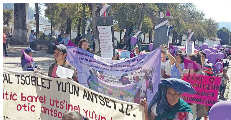
Las instituciones revictimizaban a las denunciantes y carecían de resultados óptimos.

servan costumbres machistas, donde las mujeres quedan relegadas al servicio de los hombres y la violencia es impulsada por el alto consumo de alcohol en la región. El Centro de Derechos de la Mujer de Chiapas, A.C. denunciaba que las autoridades carecían de las capacitaciones necesarias para atender a las mujeres que presentaban denuncias por agresiones; las instituciones se volvían un calvario de revictimización e indiferencia.