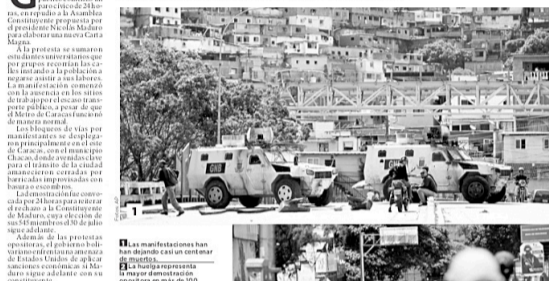
Las calles de Venezuela se vaciaron por las acciones.

A la protesta se sumaron estudiantes universitarios, que por grupos recorrían las calles instando a la población a negarse a asistir a sus labores y unirse al movimiento