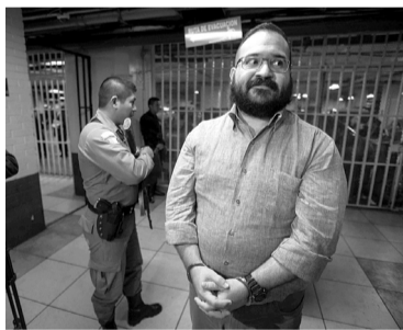
De acuerdo al portal Animal Político, el desvío de recursos federales perpetrado por la administración de Javier Duarte (2010-2016) ascienden a más de 61 Mil millones de pesos.