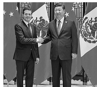
La alianza económica con China comenzaría a forjarse este año.

Con China, la segunda potencia económica del siglo, se elevó el nivel de relación al de Asociación Estratégica Integral, y para el 2024, el país asiático se convirtió en el segundo socio comercial en el mundo y tercer mercado de