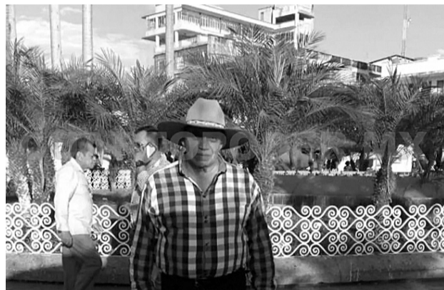
La CNDH atrajo la denuncia en contra del registro de Salazar.